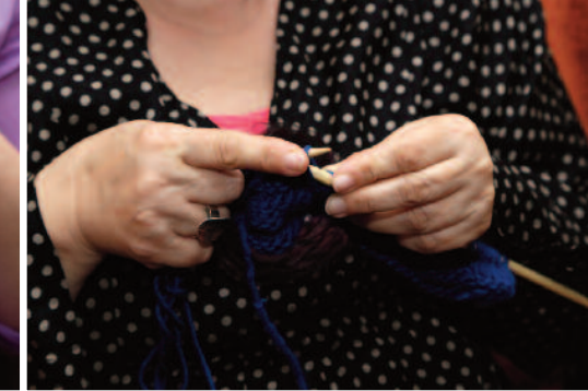
Η Πολυτίμη πλέκει!