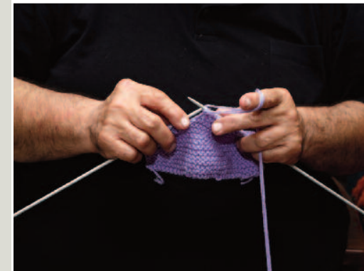
Μανόλη, δεν το ΄ξερα ότι κι εσύ πλέκεις!