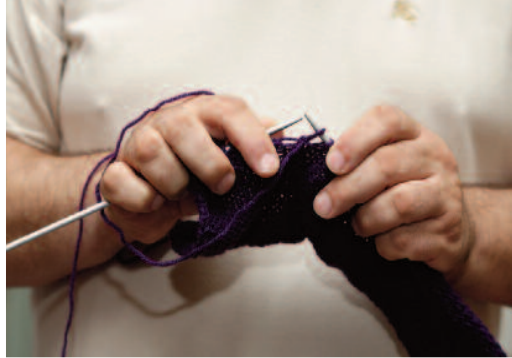
Γιώργο, είσαι εξαιρετος όταν πλέκεις!