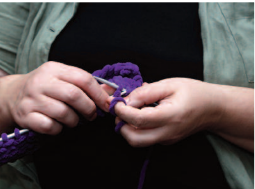
Η Τέση πλέκει...