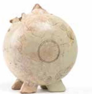
Φλασκή. 12 ος αιώνας. Κάστρο Ρεντίνας.

ΚΕΘΕΑ ΣΧΗΜΑ + ΧΡΩΜΑ [Μονάδα Γραφικών Τεχνών του Κέντρου Θεραπείας Εξαρτημένων Ατόμων]