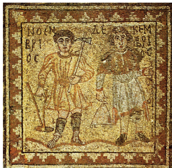
Τμήμα ψηφιδωτού δαπέδου από οικία δίπλα στο αρχαίο θέατρο, Άργος, 6ος αι. μ.Χ.

κρατάει γεωργικά εργαλεία (π.χ. τσάπια) γιατί αυτόν τον μήνα οργώνονται τα χωράφια