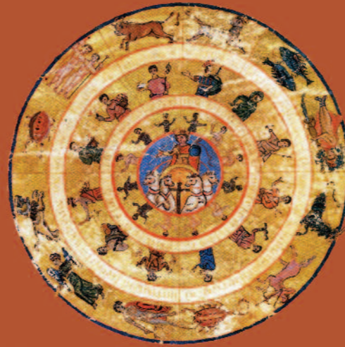
Μικρογραφία από το χειρόγραφο Αστρονομικών Πινάκων Πτολεμαίου, Βατικανό, 8ος αι. μ.Χ.