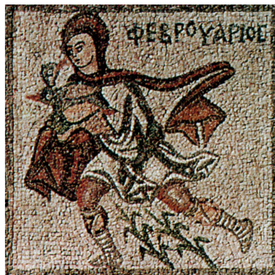
Τμήμα ψηφιδωτού δαπέδου από κτήριο στην οδό Πλουτάρχου 6, Θήβα, 6ος αι. μ.Χ.