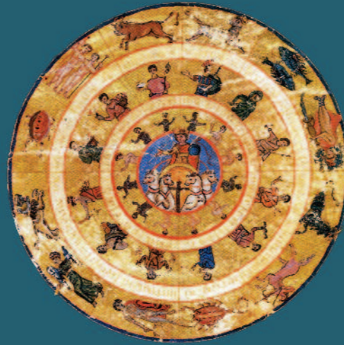
Μικρογραφία από το χειρόγραφο Αστρονομικών Πινάκων Πτολεμαίου, Βατικανό, 8ος αι. μ.Χ.