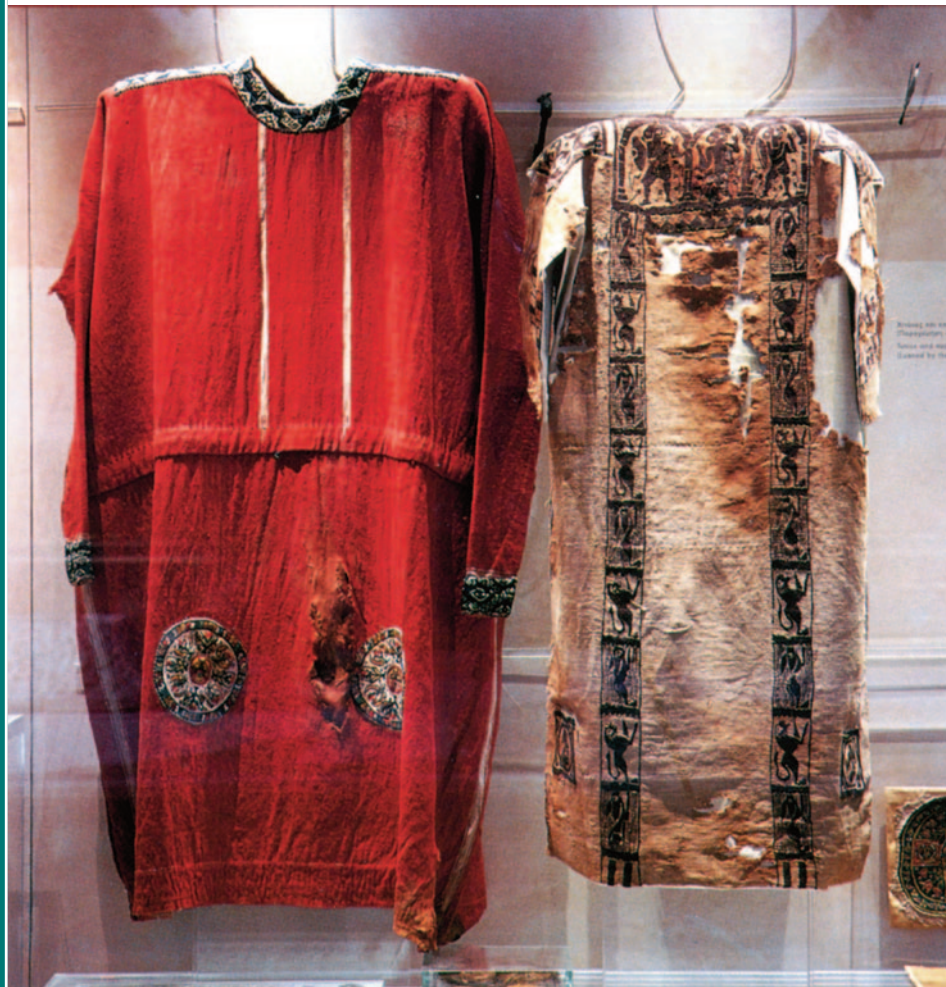
Bringing you the Photograph Tunic and the Curtain by the