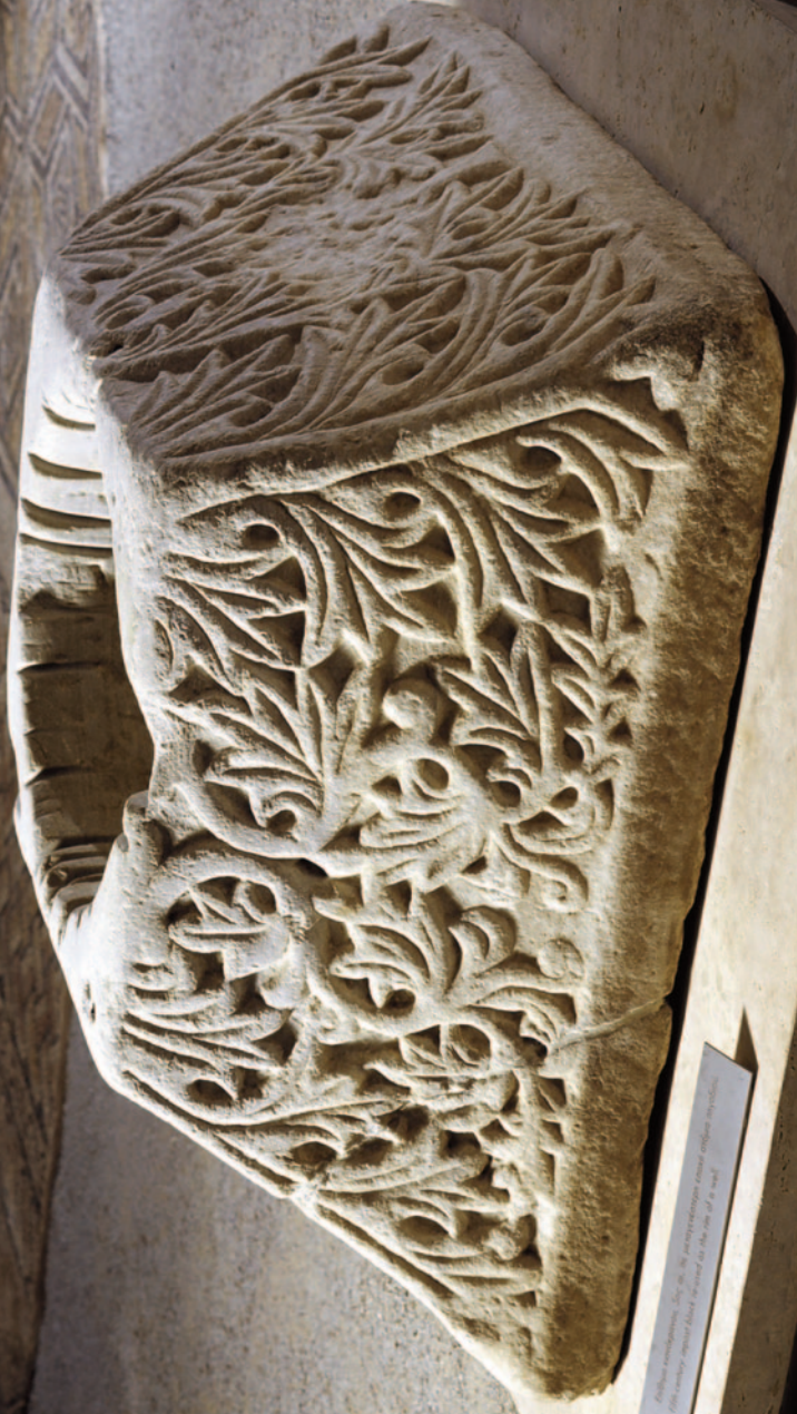
Stele of the deceased, with the name of the deceased and the name of the deceased.