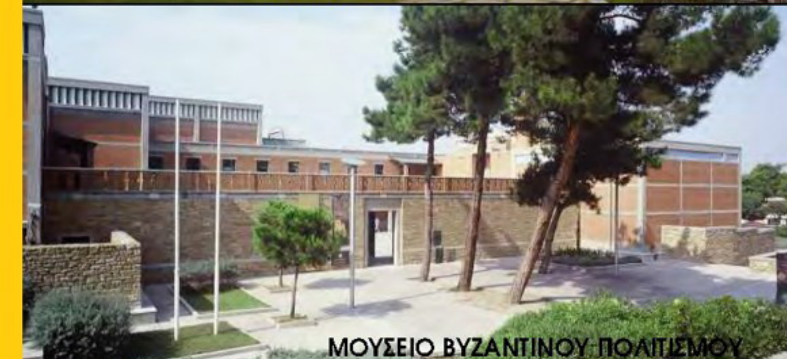
ΜΟΥΣΕΙΟ ΒΥΖΑΝΤΙΝΟΥ ΠΟΛΙΤΙΣΜΟΥ