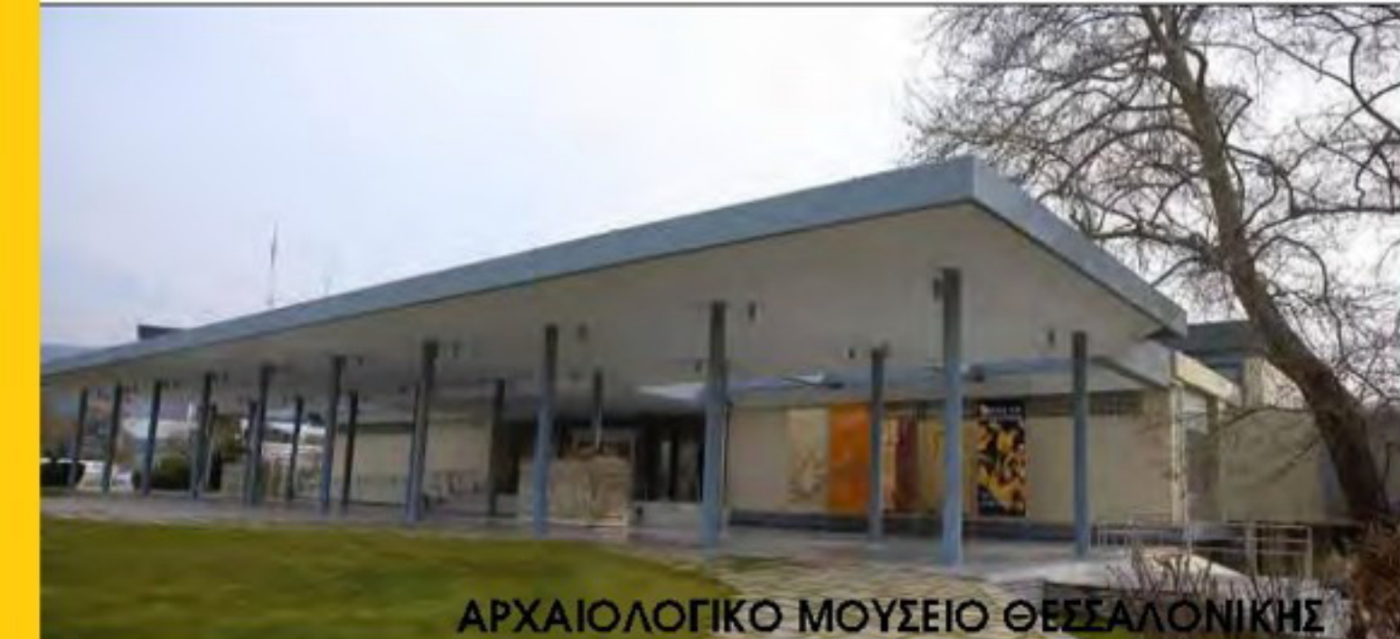
ΑΡΧΑΙΟΛΟΓΙΚΟ ΜΟΥΣΕΙΟ ΘΕΣΣΑΛΟΝΙΚΗΣ