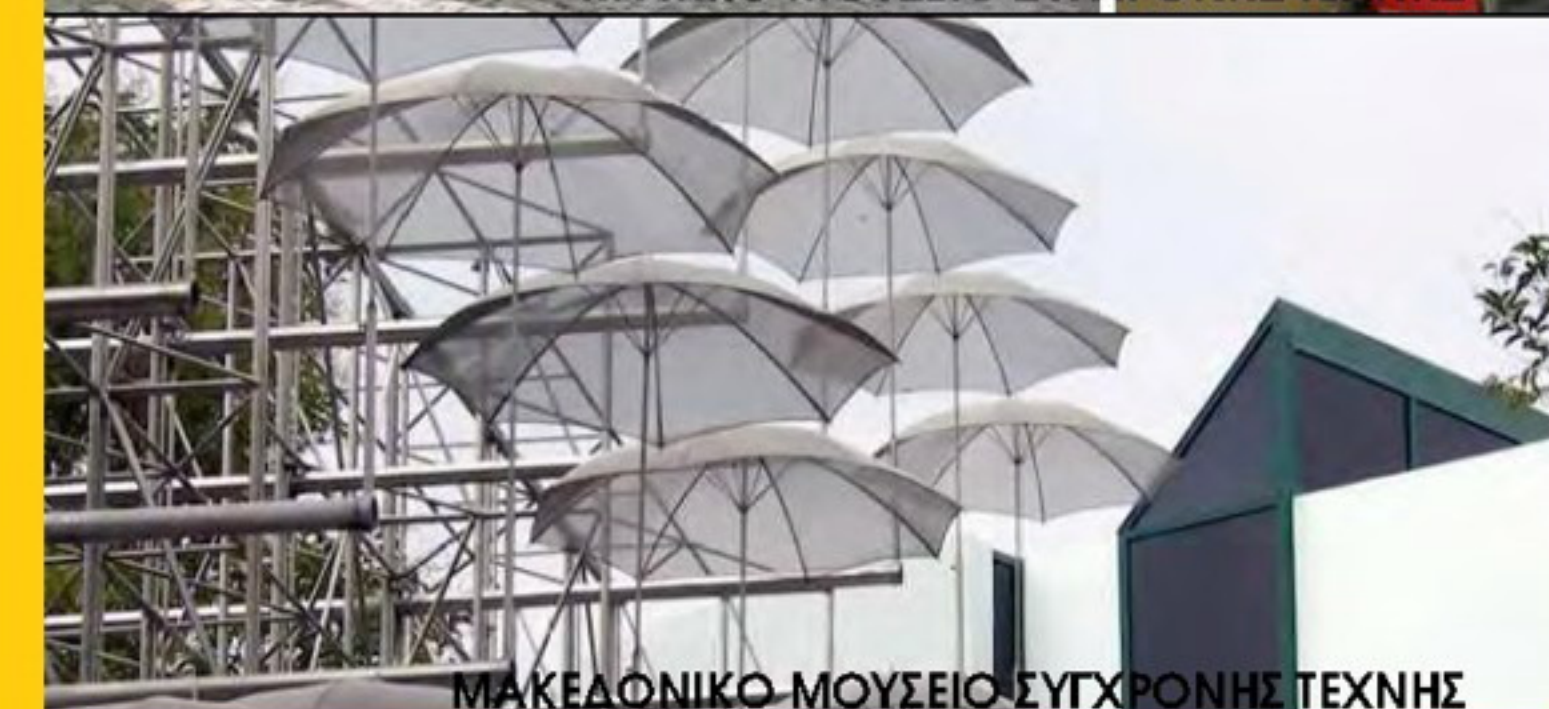
ΜΑΚΕΔΟΝΙΚΟ ΜΟΥΣΕΙΟ ΣΥΓΧΡΟΝΗΣ ΤΕΧΝΗΣ