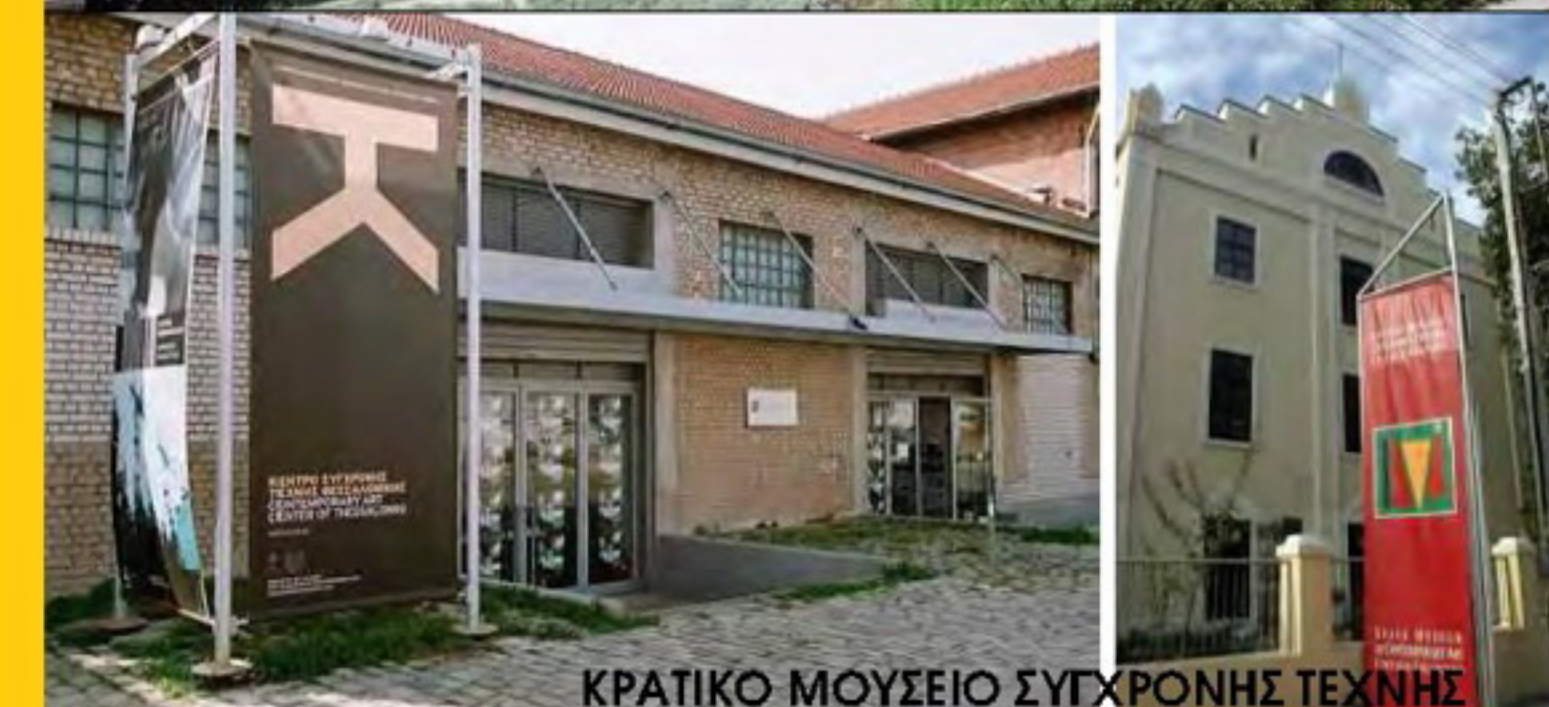
ΚΡΑΤΙΚΟ ΜΟΥΣΕΙΟ ΣΥΓΧΡΟΝΗΣ ΤΕΧΝΗΣ