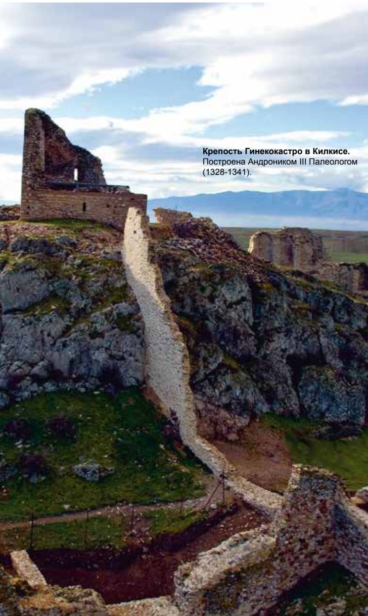
Крепость Гинекокастро в Килкисе. Построена Андроником III Палеологом (1328-1341).

Демонстрируется оборонительная система Византийской Империи, устройство города-крепости, его повседневная жизнь и производство внутри и за крепостными стенами. Представлен археологический материал из района центральной Македонии, Рендина и Гинекокастро. Дополнением экспозиции служит видеоинсталляция, информирующая посетителей о крепостях Македонии и Фракии.